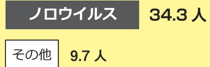
食中毒1件あたりの患者数