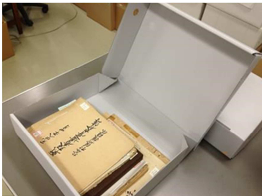
保存箱（アーカイバルボード）