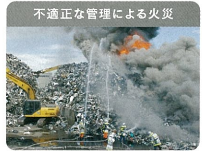
不適正な管理による火災

廃家電は電池やプラスチックを含むため、発火・延焼の危険性があり、不適正な管理による火災が発生しています。