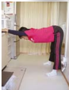
肩と太もも裏のばし