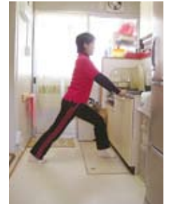
ふくらはぎ伸ばし