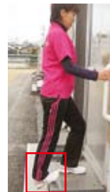
アキレス腱伸ばし