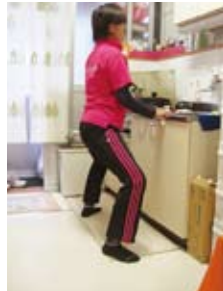
ハーフスクワット