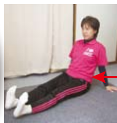
足首の曲げ伸ばし

じっとしていると足腰の血行が悪くなり、疲労や腰痛、むくみや冷えにつながります。意識して脚の血流改善を積極的に行いましょう!