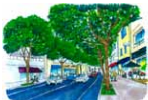
中通り沿いのイメージ