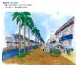
フィッシャリーナへの道路沿イメージ