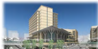
参考 カフナ旭橋 沖縄県立図書館(公式HPより)