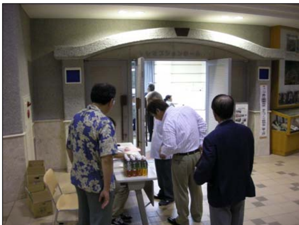
まちづくり説明会（第1回）受付の様子

今回のまちづくりニュースは、「まちづくり説明会（第1回）」及び「まちづくり勉強会（第1回～3回）」を中心にお伝えいたします。