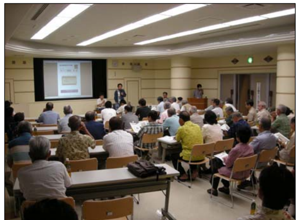
まちづくり説明会（第1回）の様子